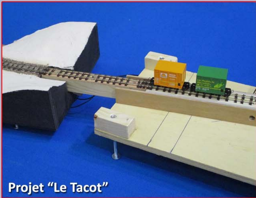
Projet "Le Tacot"