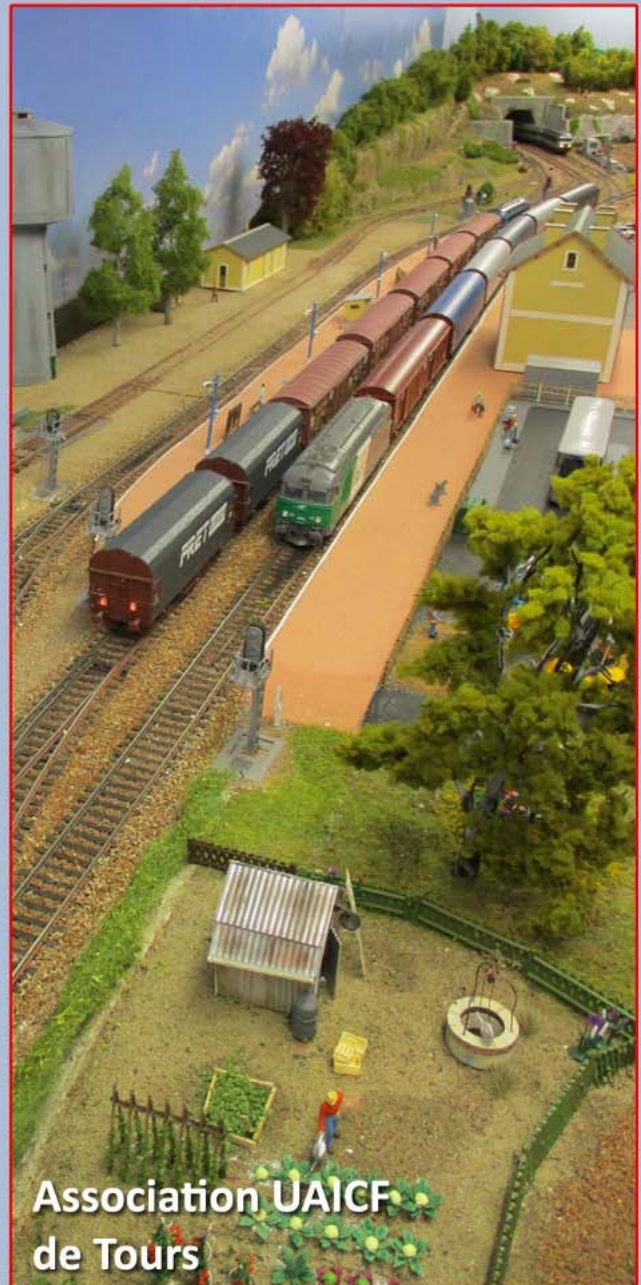
Association UAICF de Tours