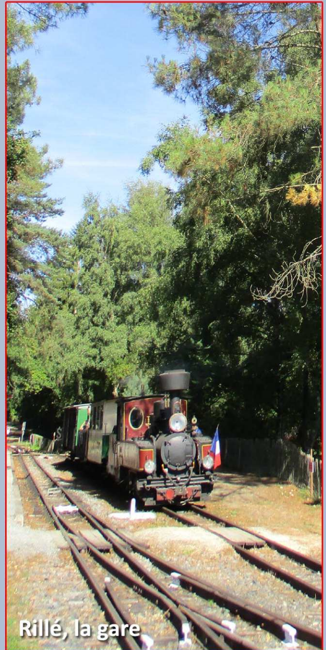
Rillé, la gare