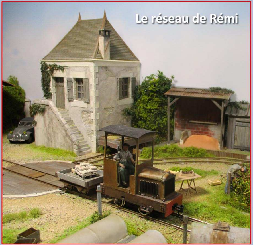
Le réseau de Rémi