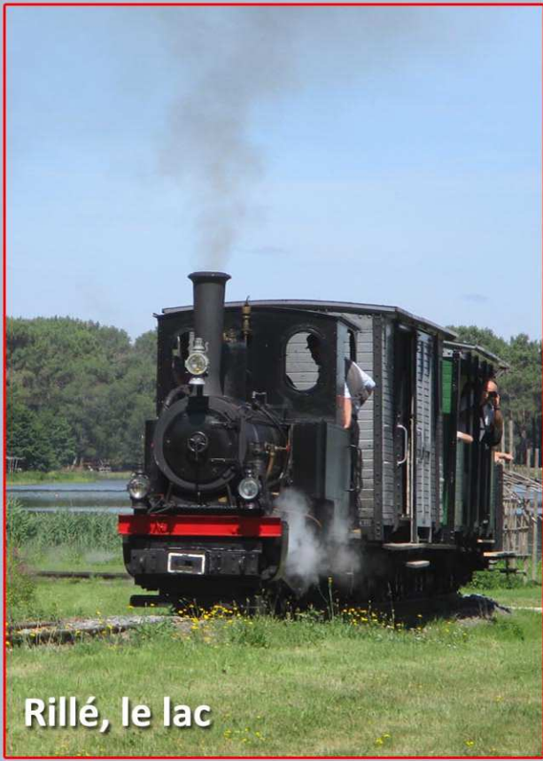
Rillé, le lac